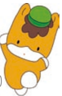
群馬県のマスコット「くんまちゃん」

【主催】厚生労働省・群馬県・前橋市・社会福祉法人恩賜財団母子愛育会 一般社団法人日本家族計画協会・社団法人母子保健推進会議