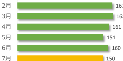
相談件数の推移（直近 6 か月）

遺族等の求めに応じて相談内容をセンターが医療機関へ伝達したものは 1 件でした。（累計 22 件）