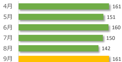
相談件数の推移（直近 6 か月）

遺族等の求めに応じて相談内容をセンターが医療機関へ伝達したものは 1 件でした。（累計 27 件）