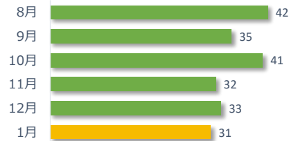
医療事故報告件数の推移（直近 6 か月）

1 月は事故発生の報告が 31 件ありました。 病院・診療所別では、病院からの報告が 30 件、診療所からの報告が 1 件でした。 診療科別の主な内訳は、外科が 6 件、内科が 5 件、消化器科が 3 件、産婦人科が 3 件、脳神経外科が 3 件、呼吸器内科が 3 件でした。