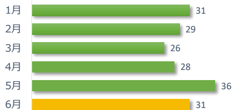
院内調査結果報告件数の推移（直近 6 か月）