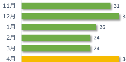
医療事故報告件数の推移（直近6か月）

4月は事故発生の報告が34件ありました。病院・診療所別では、病院からの報告が34件、診療所からの報告が0件でした。診療科別の主な内訳は、外科が5件、消化器科が5件、循環器内科が5件でした。