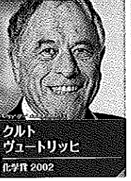
クルト ヴュートリッヒ