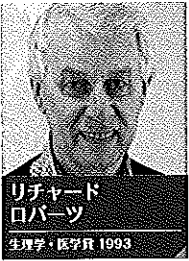
リチャード ロバーツ