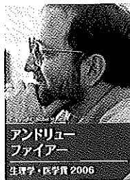
アンドリュー ファイアー